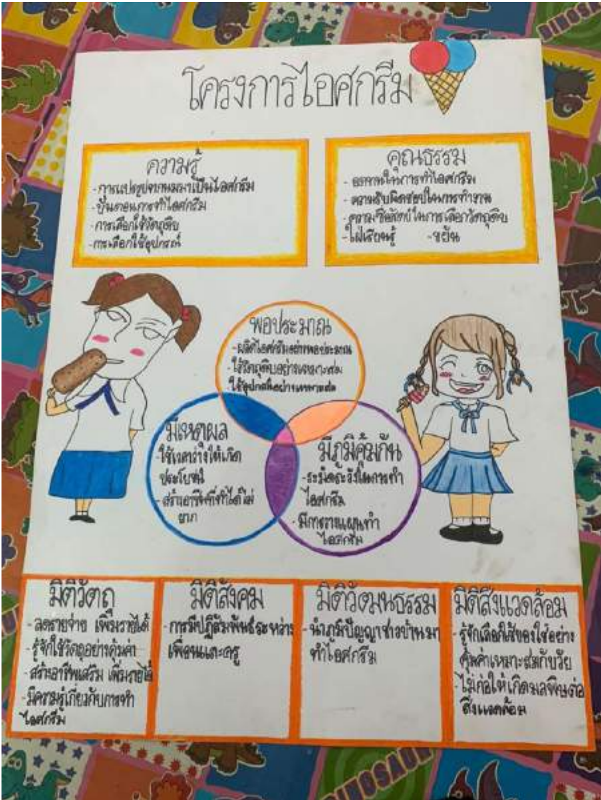
ภาพประกอบที่ 2 หลักปรัชญาเศรษฐกิจพอเพียง