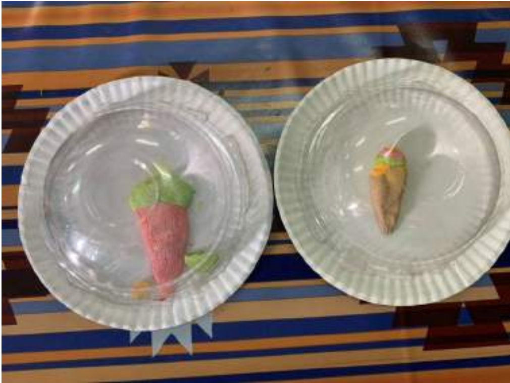
ไอศกรีมทำมาจากอะไร