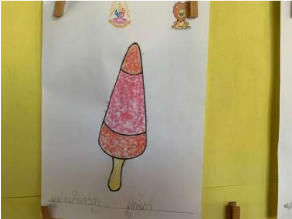
ไอศกรีมเขย่า