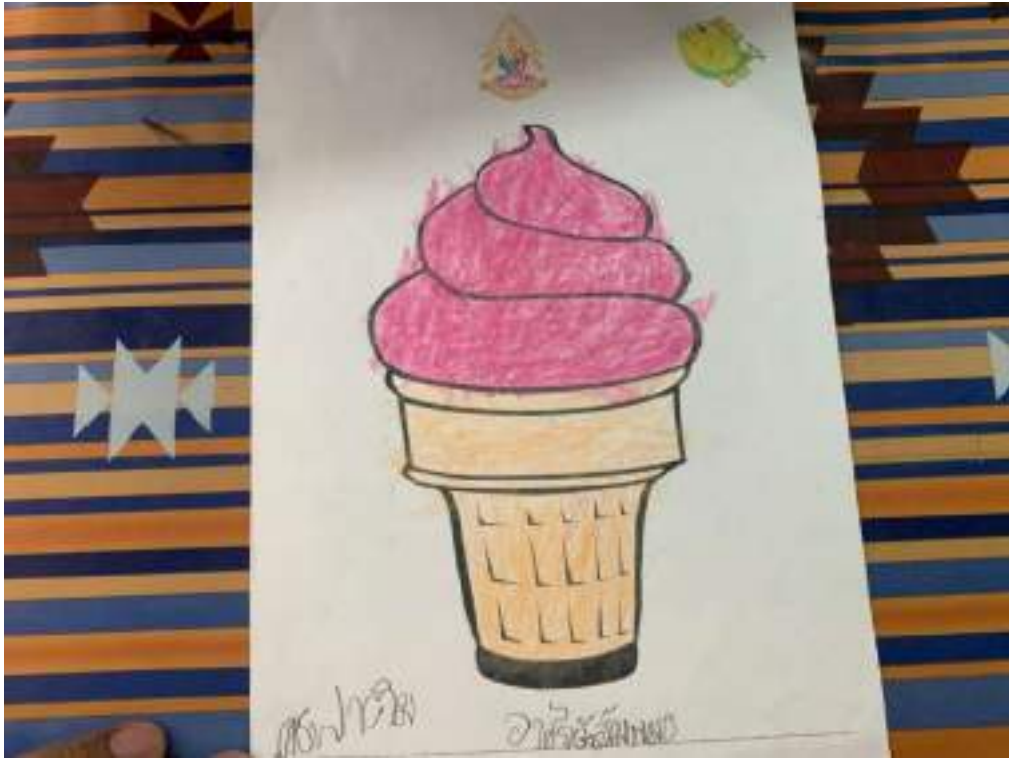
มาตกแต่งร้านค้ากัน