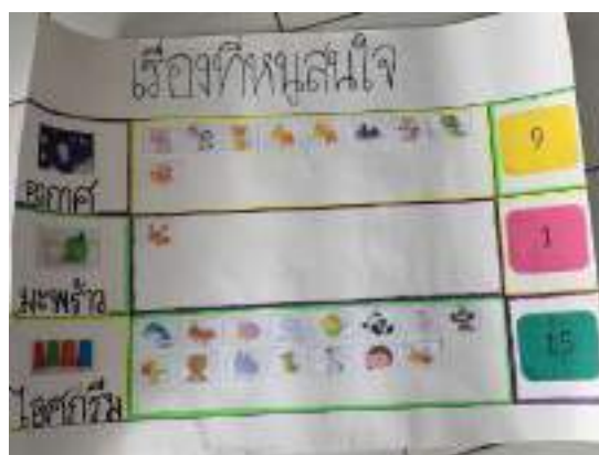
ภาพประกอบที่ 1 สํารวจเรื่องที่หนุอยากเรียน

ดังนั้น สรุปคะแนนจากความคิดของเด็ก ๆ ว่าอยากจะเรียนเรื่อง ไอศกรีม มากที่สุดจำนวน 15 คน จากนักเรียน 25 คน